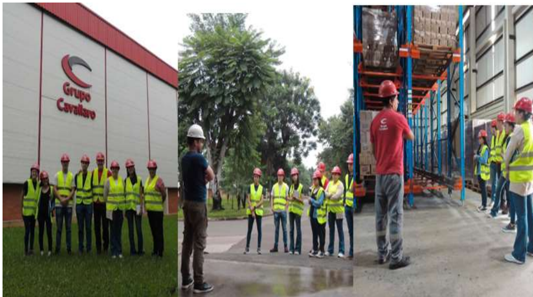
Imagen 12. Visita técnica a la fábrica CAVALLARO por alumnos de la FCE.

La visita a la fábrica del Grupo Cavallaro por parte de nuestros estudiantes de las Carreras Empresariales fue una experiencia enriquecedora. Esta fábrica se especializa en la fabricación y comercialización de productos domisanitario y cosmético con ingredientes naturales, especialmente el Aceite de Almendra de Coco. Ver imagen 12