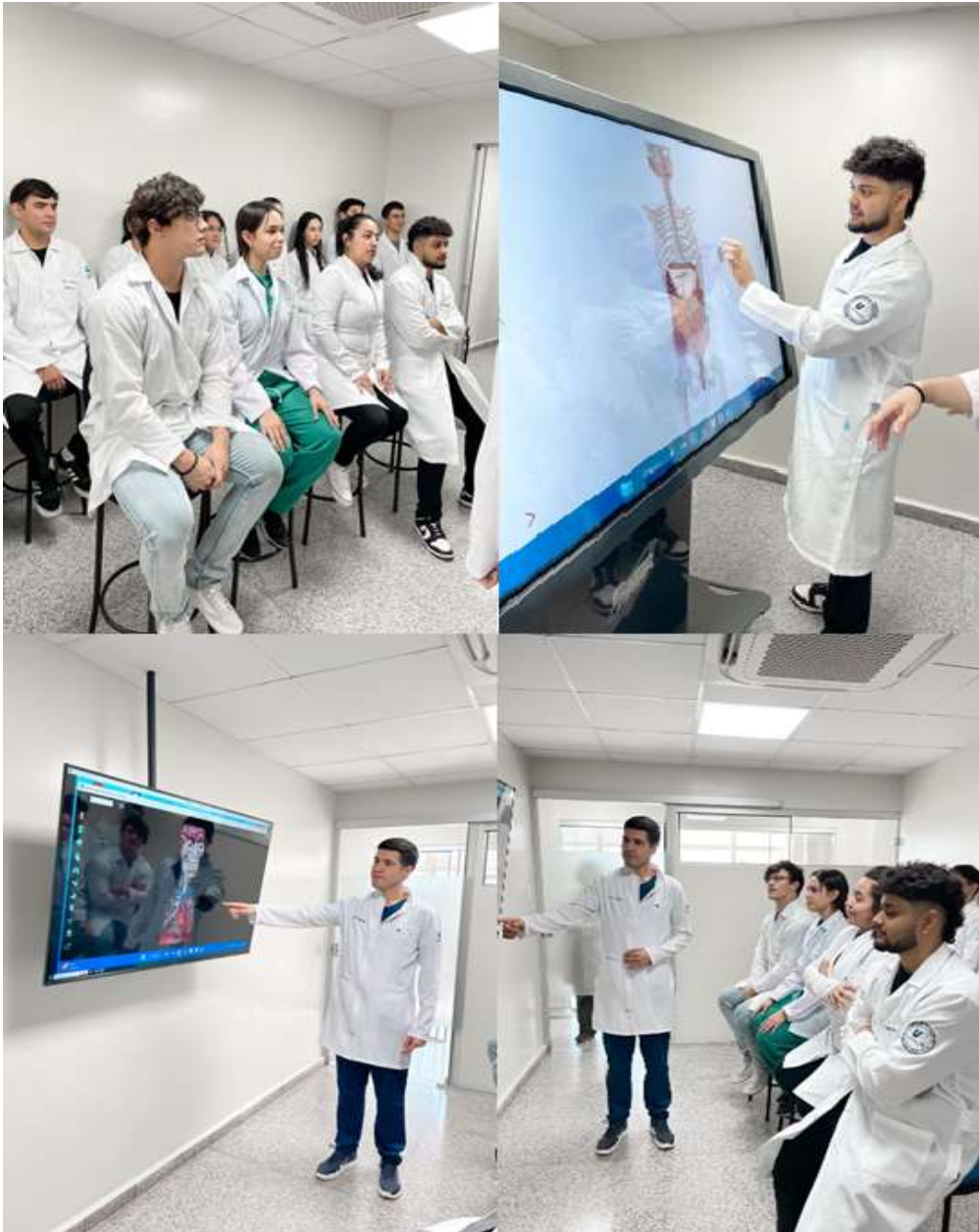
Imagen 8. Realidad Virtual como herramienta de enseñanza en la carrera de Nutrición

En la asignatura de morfofisiología de la Carrera de Nutrición de la Universidad del Pacífico, los estudiantes utilizan la Realidad Virtual (RV) para complementar su aprendizaje. Esta herramienta potencia el pensamiento crítico de los estudiantes y mejora su capacidad de tomar decisiones cuando aplican lo aprendido en la práctica. Ver imagen 8