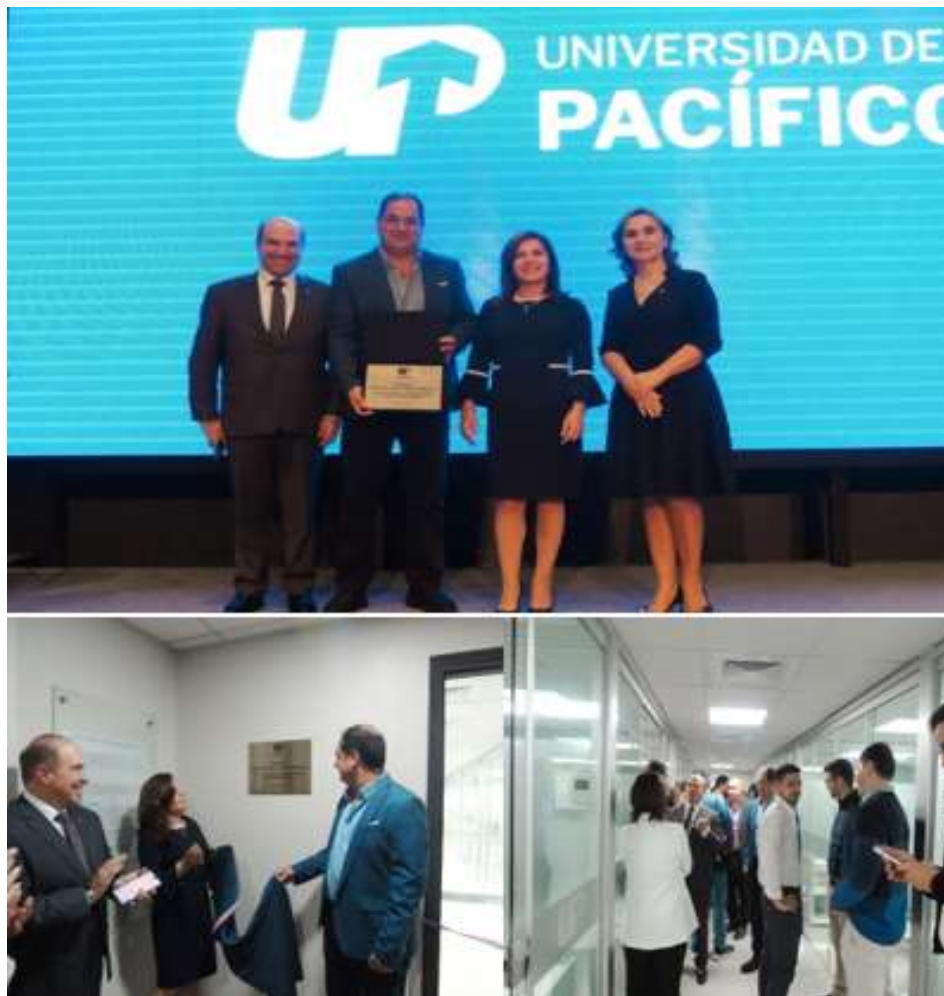
Imagen 5. Inauguración de la nueva clínica odontológica Prof. Dr. César Manzoni