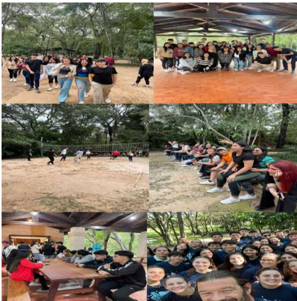
Imagen 13. Instantáneas de los alumnos de la FCR en el Ecoparque