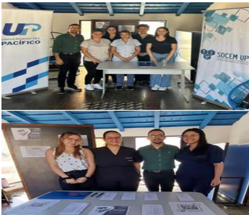
Imagen 7. Jornada de vacunación contra el COVID-19 y la Influenza

La Universidad del Pacífico organizó una exitosa jornada de vacunación contra el COVID-19 y la Influenza en colaboración con el Policlínico Municipal de Asunción. Esta iniciativa tenía como objetivo contribuir a la inmunización de la comunidad estudiantil, docente y administrativa, así como de la población en general. La jornada ofreció a los estudiantes y al personal universitario la oportunidad de inmunizarse contra enfermedades estacionales y emergentes, promoviendo un entorno saludable para todos. Ver imagen 7