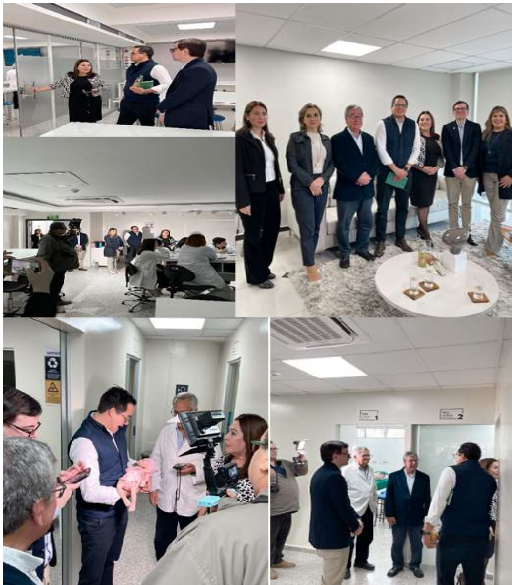
Imagen 1. Visita del Presidente del CONES a la Universidad del Pacífico-Asunción