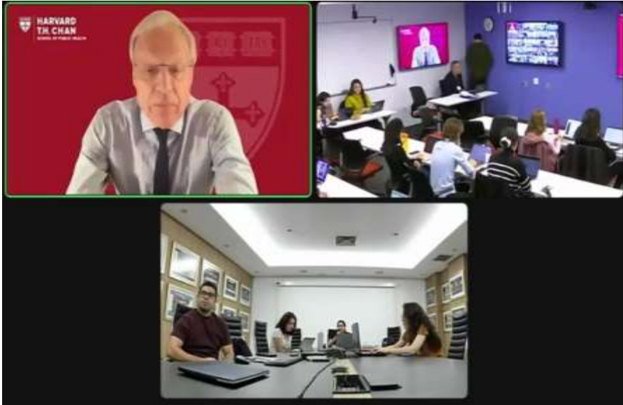
Imagen 6. Internacionalización de medicina UP con la Universidad de Harvard

La carrera Medicina, en el marco de la internacionalización de la carrera realiza curso con la Facultad de Salud Pública de la Universidad de Harvard. El curso Principles and Practice of Clinical Research (PPCR) de la Harvard T.H. Chan School of Public Health, ofrecido por el departamento de educación continua ECPE, tiene como misión principal formar investigadores clínicos y crear una red global de investigación. Utilizando tecnología avanzada y métodos colaborativos de aprendizaje, el programa es impartido por profesores experimentados de Harvard. Ver imagen 6