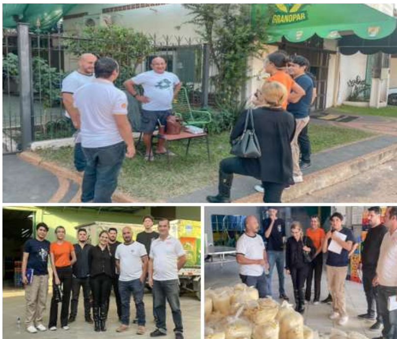
Imagen 10. Visita técnica a GRANOPAR por alumnos del 1er año de la FCE

Estudiantes del primer año de las carreras empresariales realizaron una visita a la fábrica GRANOPAR, una empresa dedicada al procesamiento de alimentos especializados en harinas de maíz y arroz. Esta compañía, de carácter familiar, fue fundada por el Sr. Eulalio Garcete en 1980, localizada en el barrio Laurelty de Luque. Ver imagen 10