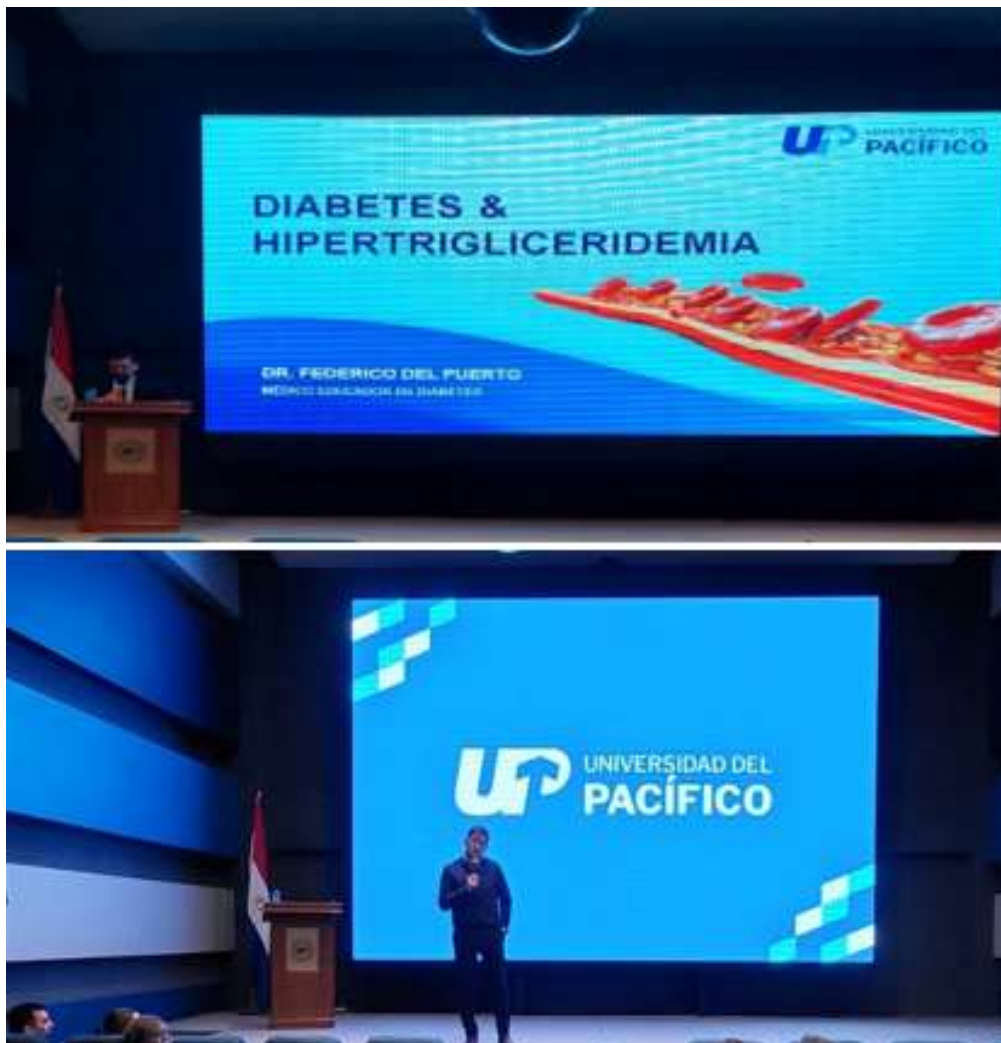
Imagen 4. Simposio de Diabetes e Hipertrigliceridemia en la Universidad del Pacífico