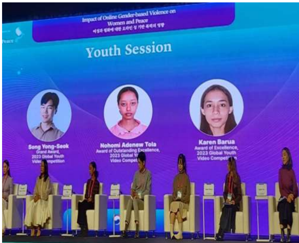
Imagen 1. Ganadores del "Concurso Global de Videos para la Juventud 2023"