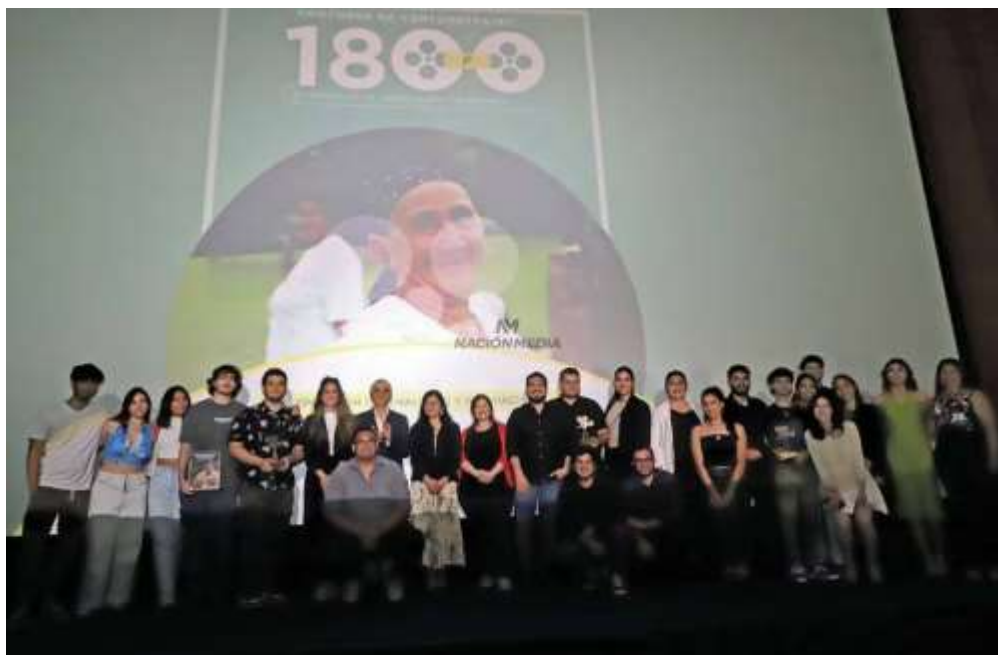
Imagen 5. Los tres equipos ganadores del primer concurso de cortometrajes