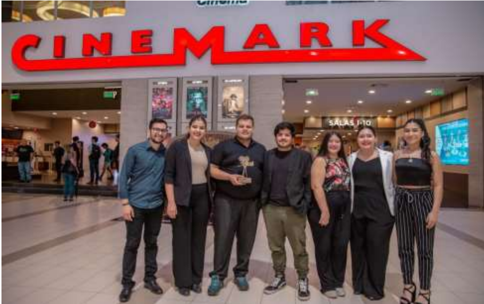
Imagen 3. Ganadores del segundo puesto "El valor de un balón"