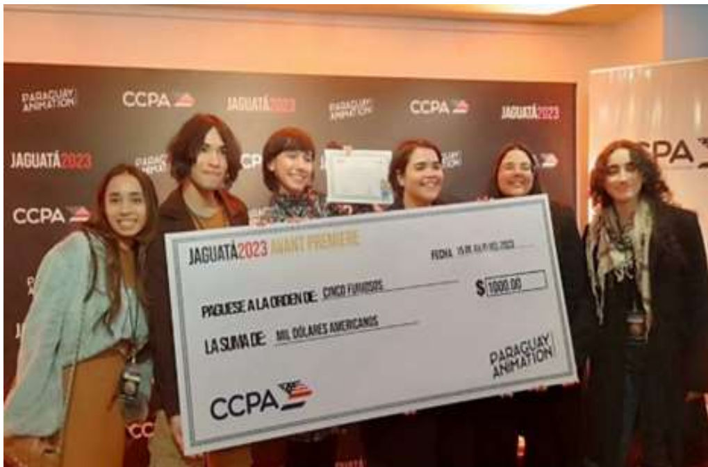
Imagen 1. Ganadores de la 3ra. Edición del concurso de "Cortos Animados Jaguatá 2023"