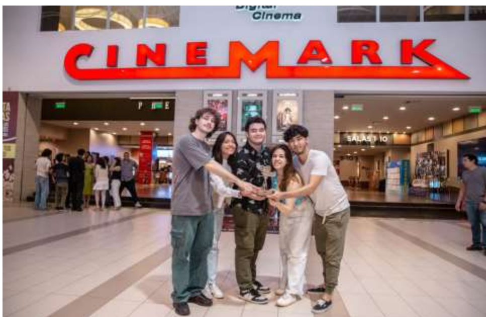
Imagen 2. Ganadores del primer puesto "Rompiendo barreras"