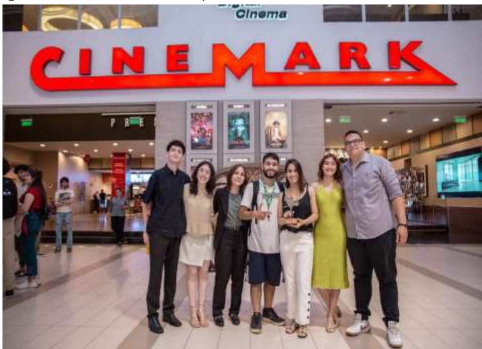
Imagen 4. Ganadores del tercer puesto "Hacia adelante"