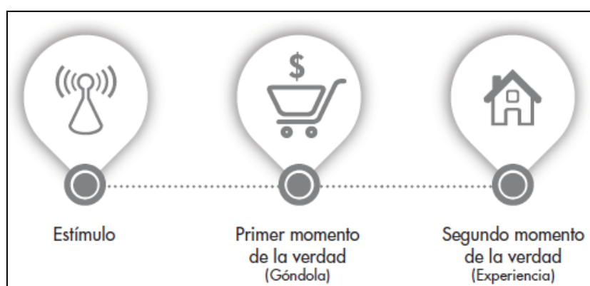
Figura 1. Proceso del modelo tradicional de compra