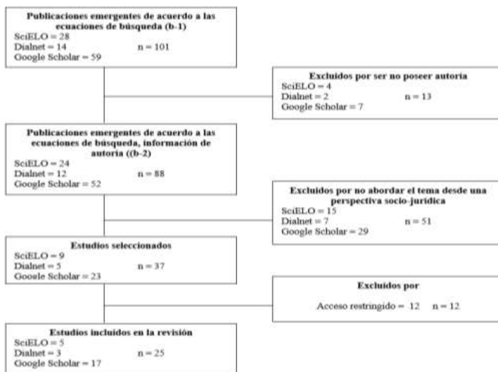
Figura 1. Diagrama de flujo

En la figura 1, se presenta el diagrama de flujo que permitió evidenciar el proceso de exclusión de documentos, lo que resultó en un total de 25 documentos que fueron cuidadosamente procesados y analizados, la cual permitió dilucidar las palabras que se empleaban con mayor frecuencia dentro de los documentos, permitiendo así constituir las unidades de análisis