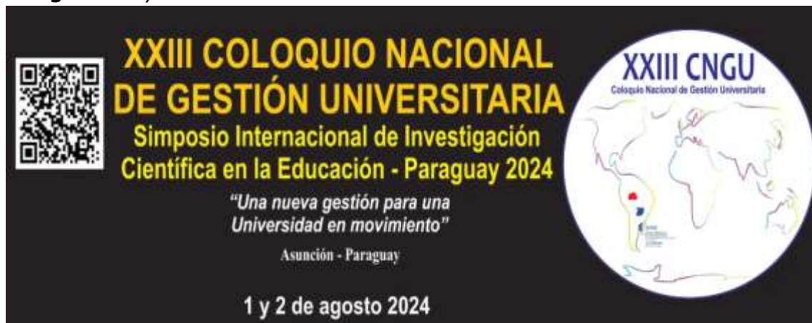
Imagen 3. Flyer de invitación al XXIII CNGU 2024