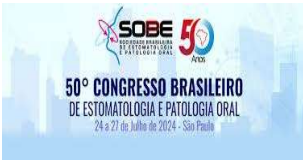
Imagen 1. Flyer de invitación al congreso SOBEP