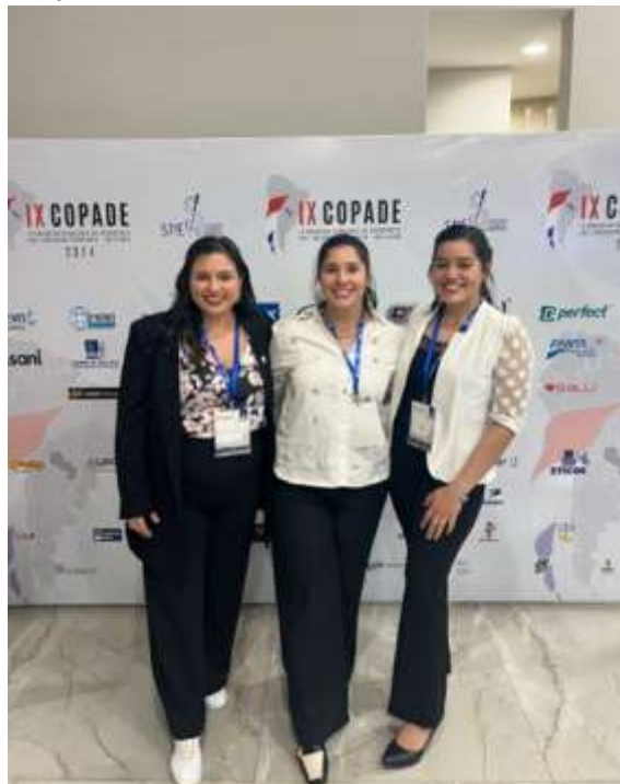
Imagen 8. Estudiantes y docentes de la Universidad del Pacífico