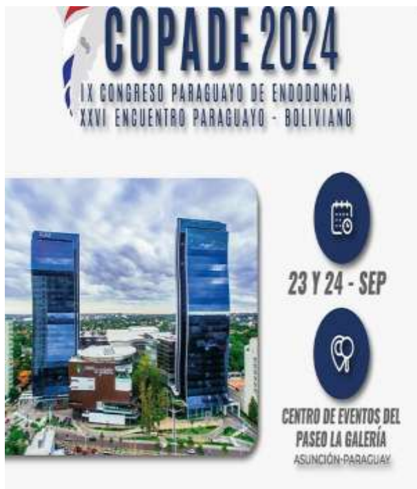
Imagen 7. Flyer de invitación COPADE 2024