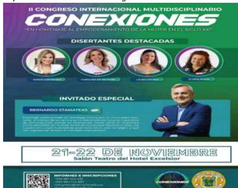
Imagen 19. Flyer de Invitación al II Congreso Internacional Multidisciplinario