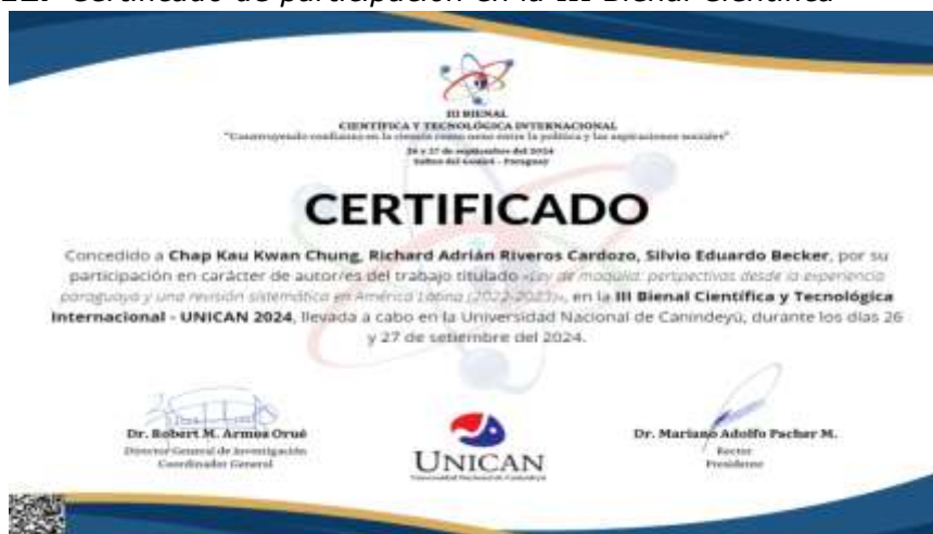
Imagen 12. Certificado de participación en la III Bienal Científica