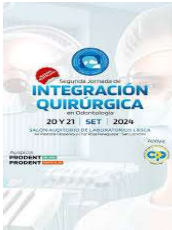
Imagen 5. Flyer de invitación a la 2da. Jornada de Integración Quirúrgica en Odontología