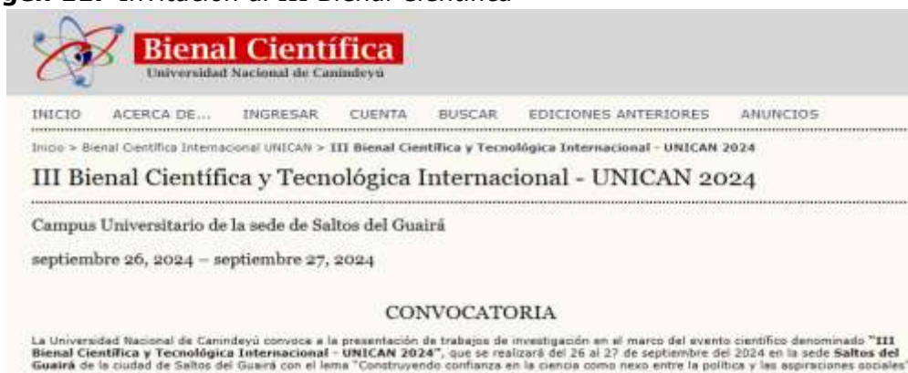
Imagen 11. Invitación al III Bienal Científica