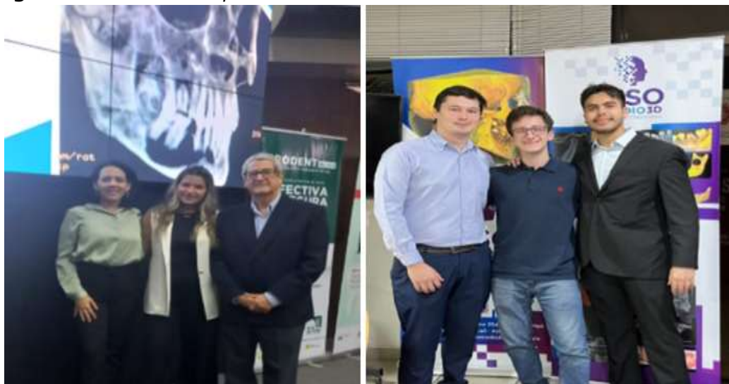
Imagen 6. Estudiantes expositores de la Universidad del Pacífico