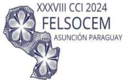
Imagen 13. Flyer de Invitación al XXXVIII CCI 2024 FELSOCEM