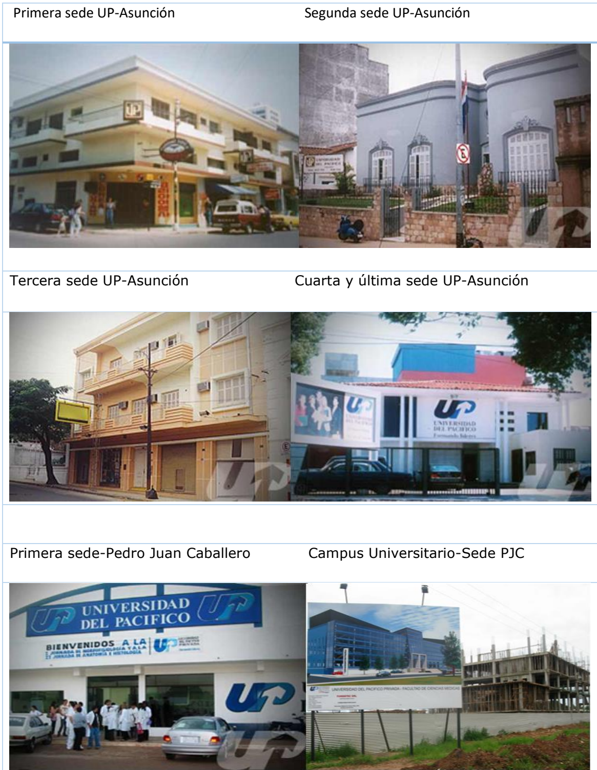
Figura 3. Sedes de la Universidad del Pacífico a lo largo del tiempo