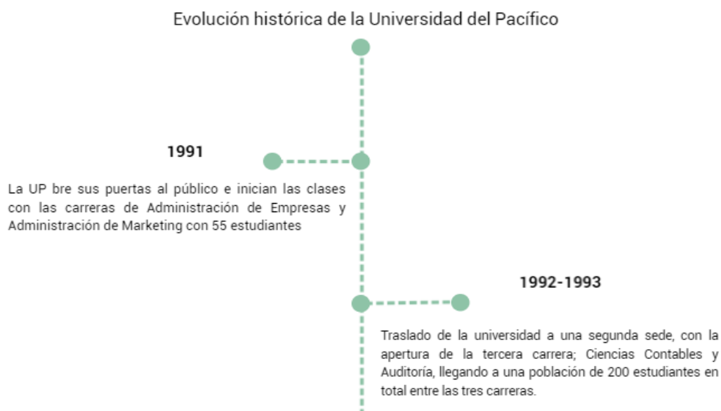
Figura 1. Hitos y desafíos más importantes en la historia de la Universidad del Pacífico durante estos 30 años de existencia

Desde 1991 la Universidad del Pacífico ha formado parte de la historia, participando activamente en la construcción de la educación universitaria paraguaya, desde el pensamiento académico hasta la intervención social. A continuación, se reflejan los treinta años de hitos y desafíos en la evolución histórica de esta casa de estudios (Universidad del Pacífico, s.f.):