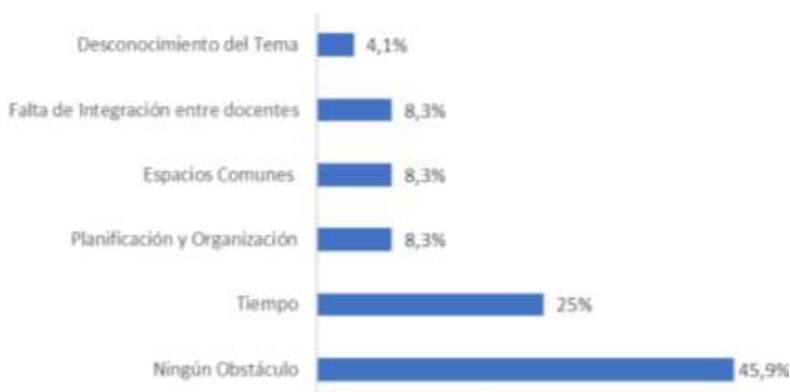
Gráfico 1: Barreras identificadas por los docentes sobre el tema de interdisciplinaridad

La siguiente pregunta formulada fue cerrada y con tres opciones posibles. Un 100% indicó que trabajar interdisciplinariamente constituye una oportunidad para construir con otras disciplinas. Se puede constatar que se dieron otras opciones menos optimistas, sin embargo, no fueron elegidas. Si bien la mayoría de los profesores indicó no contar con experiencia en trabajos interdisciplinarios con sus colegas, se les preguntó si perciben algunas barreras o dificultades para implementar proyectos conjuntos. Las respuestas a esta pregunta son bastante alentadoras, en razón de que 11 docentes manifiestan no encontrar ningún obstáculo para implementar la interdisciplinariedad, casi la mitad del plantel. Ahora bien, las otras tres categorías de agrupación incluyeron: tiempo (25%), planificación y organización (8,3%), espacios comunes (8,3%), desconocimiento del tema y falta de integración entre docentes (8,3%). Son aspectos relevantes en tanto que constituyen oportunidades de mejora para la institución, con los que esta podrá trabajar (ver Gráfico 1).