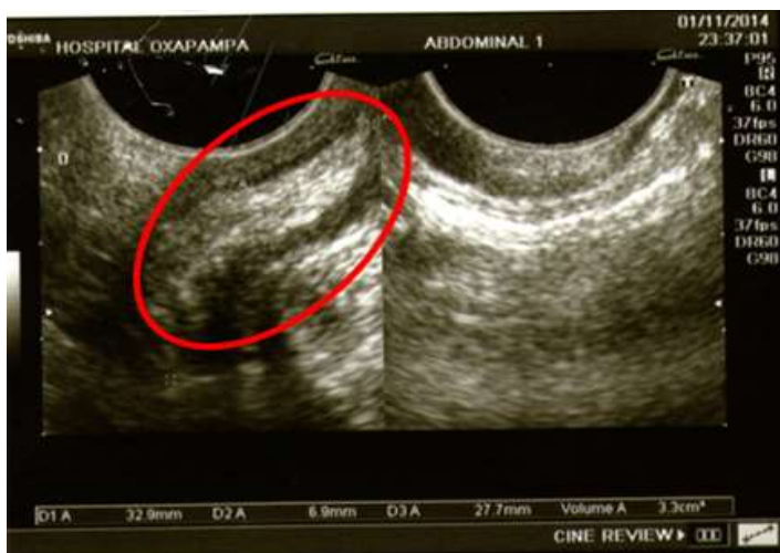
Figura 1. Se evidencia el aumento del diámetro transversal del apéndice (>6mm).